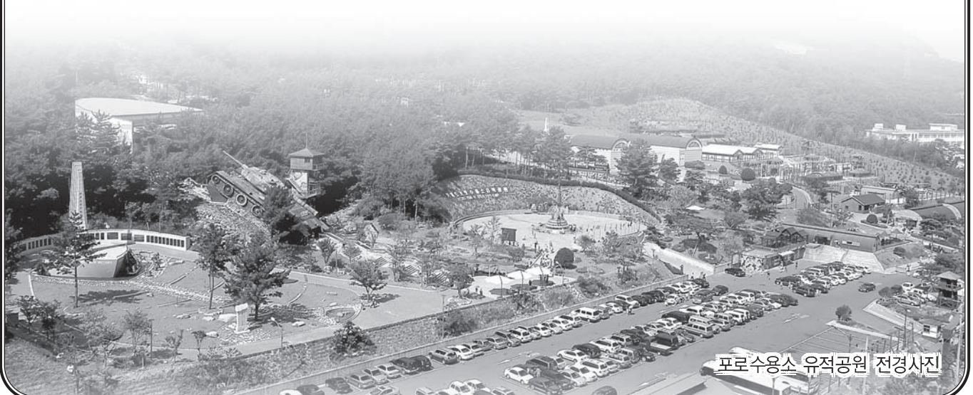
포로수용소 유적공원 전경사진